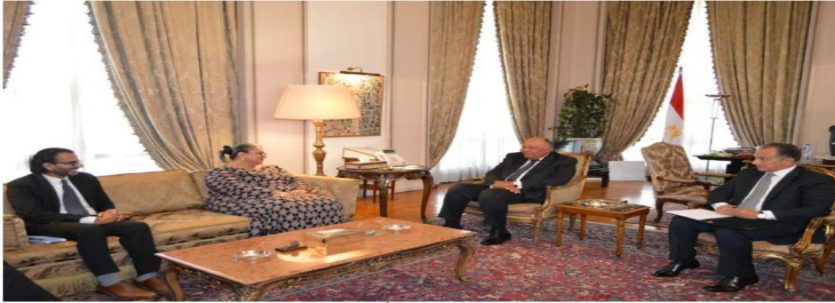
سامح شكري مع هنا تيتي مبعوثة سكرتيرة عام الأمم المتحدة الخاصة للقرن الإفريقي

صورة رقم (١) من موقع الاهرام تناولت تأكيد الدكتور سامح شكري وزير الخارجية علي موقف مصر الثابت والتمسك بضرورة التوصل إلى اتفاق شامل حول سد النهضة في أقرب وقت ممكن، نظراً لما يمثله بقاء الوضع الحالي من عنصر عدم استقرار يهدد مصالح شعوب المنطقة، ليس فقط الآن، ولكن للأجيال القادمة وذلك خلال استقباله لمبعوثة سكرتيرة عام الأمم المتحدة الخاصة للقرن الإفريقي "هنا تيتي" في ١١ سبتمبر ٢٠٢٢.