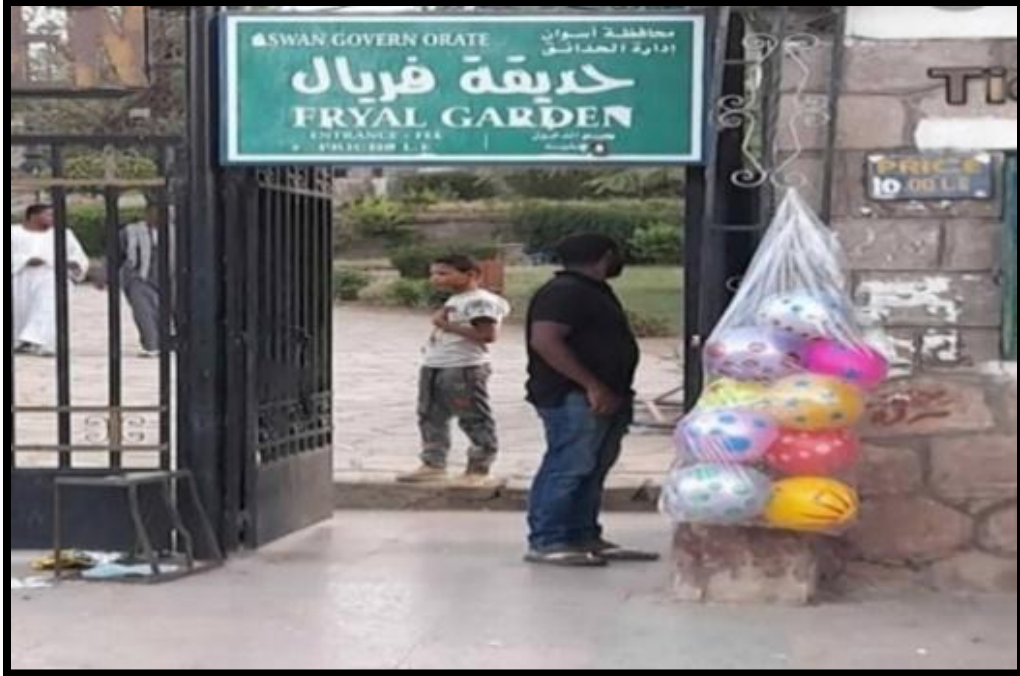
صورة رقم [٤] توضح مدخل حديقة الاميرة فريال ابنت الملك فاروق وتقع بجوار قرية جبل تفوق.