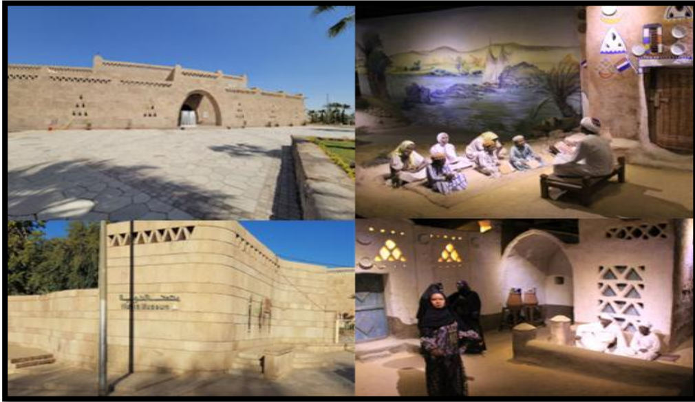
صورة رقم [٣] توضح متحف النوبي اول دخلت قرية جبل تفوق والتراث والثقافة النوبية من داخله.