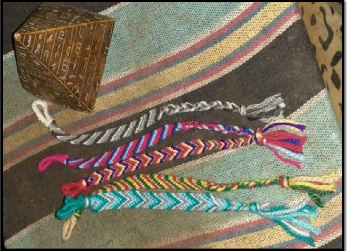
صورة رقم [٧] توضح حفاظات ملونة مصنوعة من الخيوط الكروشيه.

الالوان برسومات تكون خاصة بالنوبة وهى مثل العصافير والحمام ورسم بعض المثلثات الملونة التي يشتهر بها اهل النوبة وبعدها تطورت صنع الطواقي وأصبحت بخيط الكروشيه وهو عبارة عن خيط من القطن يصنع منه الطواقي النوبية التي تتميز بالألوان الكثيرة ومن الطواقي المشهورة هى طقية بكار النوبية التي تباع في جميع الإمكان في السوق السياحي بأسوان.*