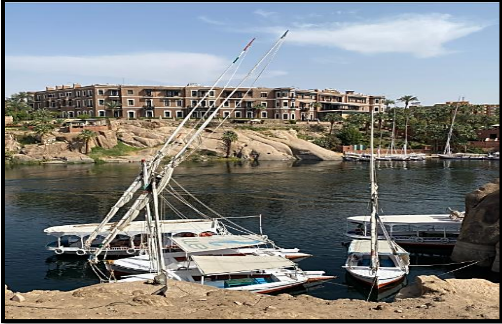
صورة رقم [٢] توضح فندق اولد كترراكت بجانب قرية جبل تفوق من ناحية النيل.