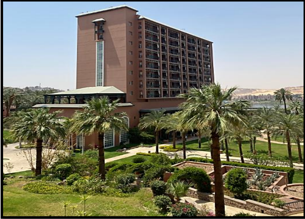
صور رقم [١] توضح فندق نيو كتركت بجانب قرية جبل تقوق النوبية.

مصرية قديمة للفراغة وبجنب البلد أيضا فندق نيو كتركت يطل علي قرية جبل تقوق من اعلي لتواجهه بجانب القرية وهناك متحف النوبة الذي يضم تراث النوبة وتقاليد وازياء ومساكنهم وبعض الاثار المصرية والنوبية وهناك المعابد الاثرية في النيل مباشرة بجانب القرية وهناك معابد بجزيرة الفنتين من ناحية النيل.*