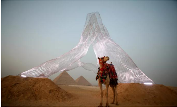
صورة (٢) معرض الأبد هو الآن

أولاً: بيانات الصورة: صورة صحفية، بعنوان "أحضان الفراعنة تبهج العالم.. مصر تطلق أول معرض دولي للفنون على أرض الأهرامات"، في يوم ٢٥ أكتوبر ٢٠٢١.