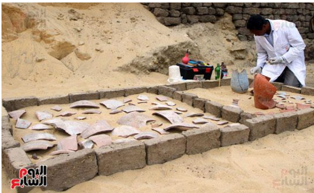
صورة (٦) صورة لمرمم آثار أثناء عمله