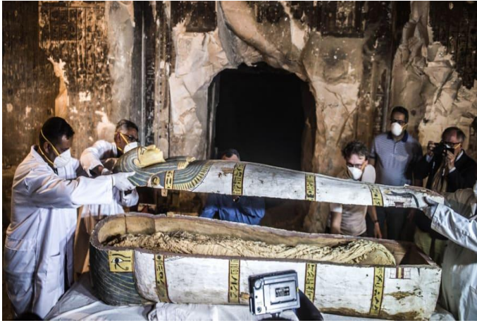
صورة (١) تبين الكشف الأثري بأسوان