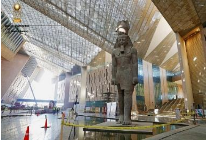
صورة (٣) المتحف المصري الكبير من الداخل